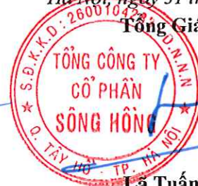
Lã Tuấn Hưng