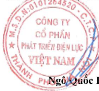
Ngô Quốc Huy