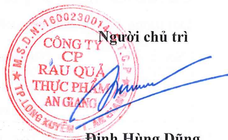
Đinh Hùng Dũng