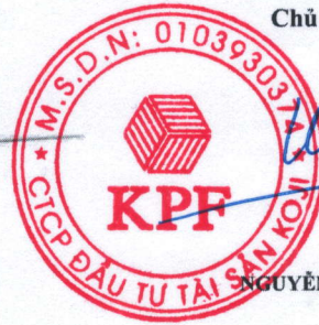
NGUYỄN KHÁNH TOÀN