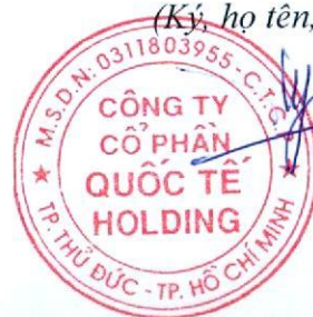
Đặng Thúy Vy