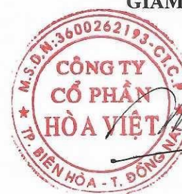
Lương Hữu Hưng