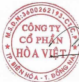
Lương Hữu Hưng