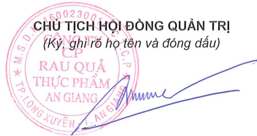
Đinh Hùng Dũng