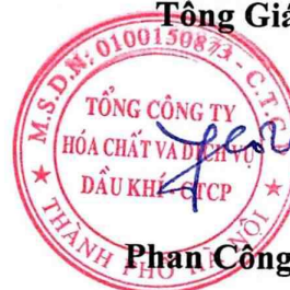
Phan Công Thành