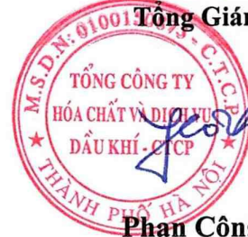
Phan Công Thành