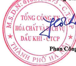
Phan Công Thành