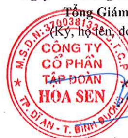
Trần Quốc Trí