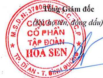
Trần Quốc Trí