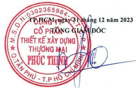
TRẦN MINH TRÚC