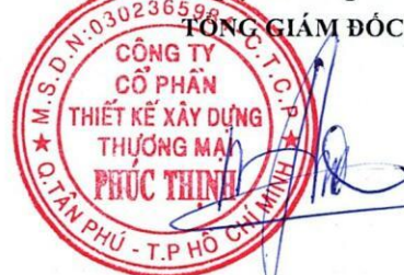
TRẦN MINH TRÚC