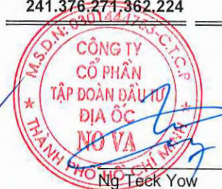
Ng Teck Yow