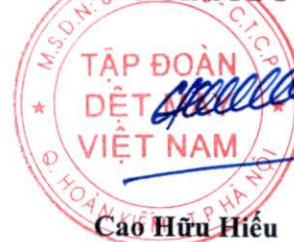
Cao Hữu Hiếu