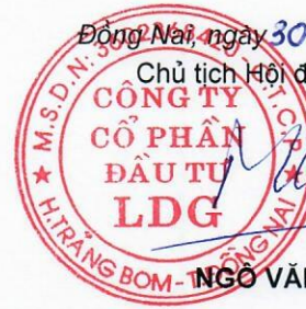
NGO VĂN MINH