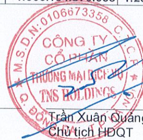
Trần Xuân Quảng Chủ tịch HĐQT