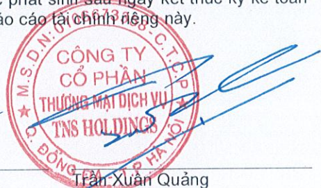
Trần Xuân Quảng Chủ tịch HĐQT