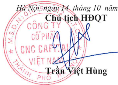
Trần Việt Hùng