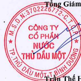
Trần Thế Hưng