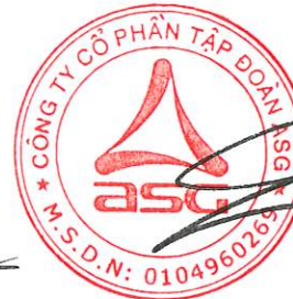
Dương Đức Tính Chủ tịch Hội đồng quản trị