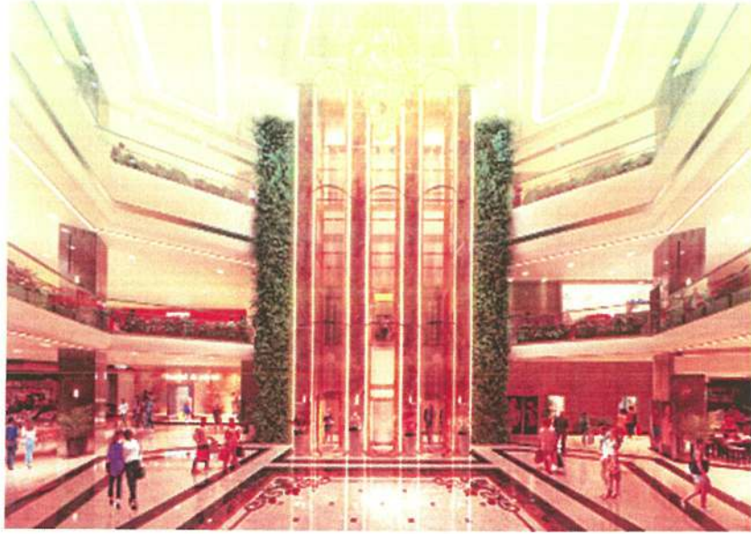
Sảnh giao thông chung tầng 1 của tòa nhà H1