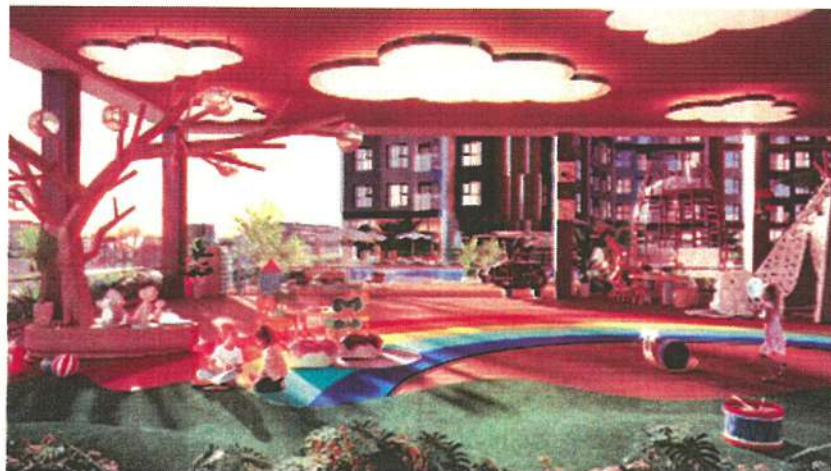
Khu vui chơi trẻ em