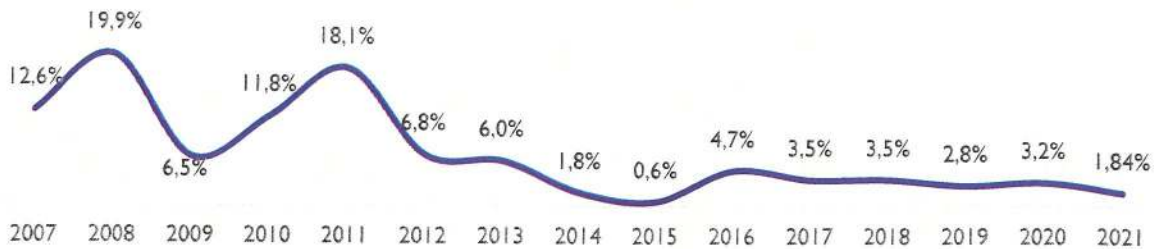
Hình 1: Tỷ lệ lạm phát của Việt Nam giai đoạn 2007-2021

Tuy nhiên, áp lực lạm phát trong năm 2022 là hiện hữu do nguy cơ “nhập khẩu lạm phát”. Theo Tổng cục Thống kê, bước sang năm 2022, nếu dịch Covid-19 được kiểm soát, nhu cầu sản xuất và tiêu dùng tăng lên, lạm phát sẽ chịu tác động của vấn đề tăng giá nguyên, nhiên, vật liệu trên thế giới như xăng dầu, than và giá cước vận chuyển. Việc nhập khẩu nguyên liệu với mức giá cao sẽ ảnh hưởng đến chi phí sản xuất, giá thành sản phẩm, từ đó đẩy giá hàng hóa tiêu dùng trong nước lên cao, tạo áp lực cho lạm phát, dẫn đến việc người tiêu dùng sẽ thắt chặt chi tiêu hơn, ảnh hưởng trực tiếp đến doanh thu của doanh nghiệp. Việc chi phí sản xuất tăng cũng ảnh hưởng xấu đến biên lợi nhuận của doanh nghiệp khi chi phí xây dựng tăng, nhưng giá thành sản phẩm được quyết định theo cung cầu của thị trường.