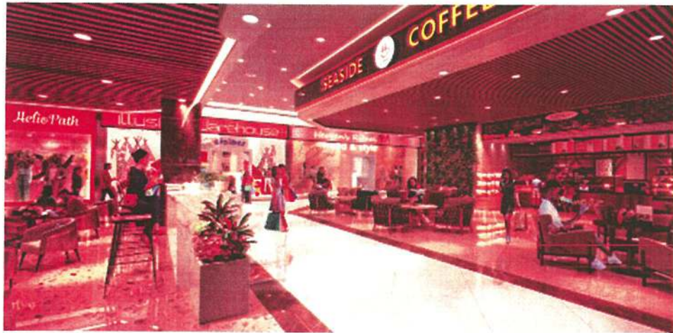
Trung tâm thương mại, mua sắm và ăn uống