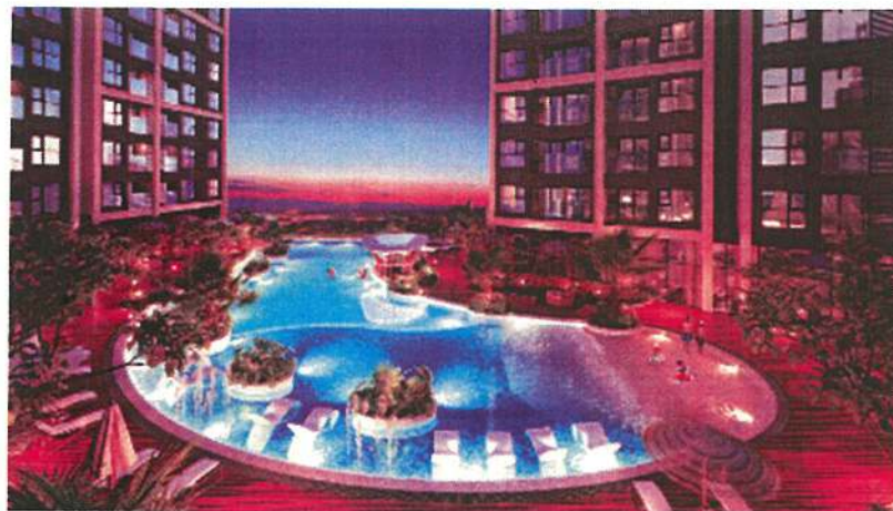
Bể bơi vô cực trên cao đầu tiên tại Thành phố Hải Phòng