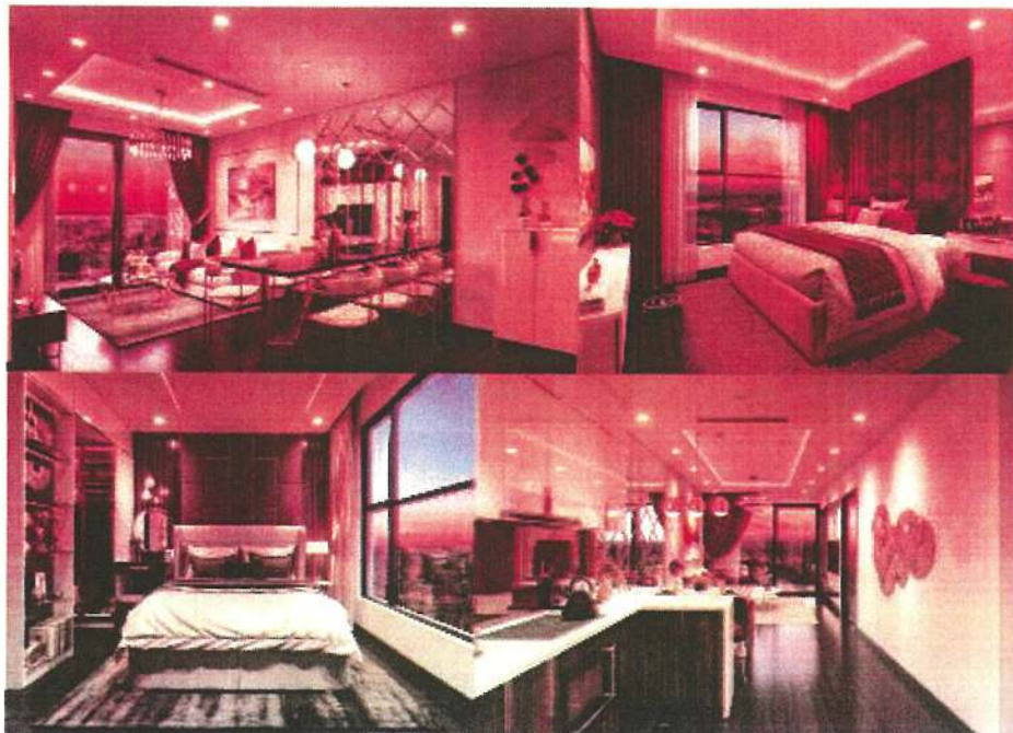
Căn hộ mẫu phong cách hiện đại, đáng sống tại thành phố Cảng