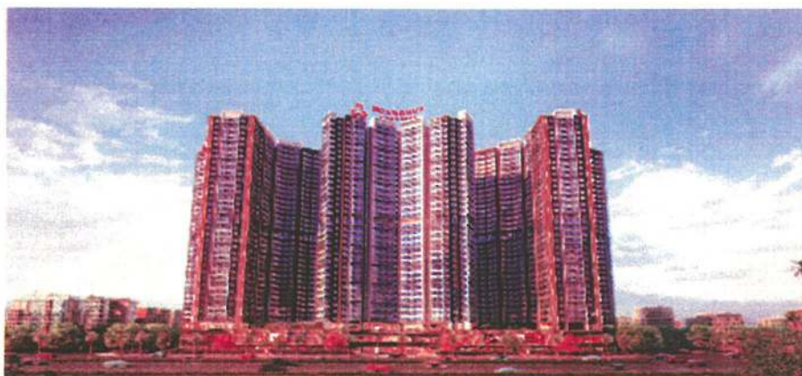
Mặt trước lô H1 giáp đường Võ Nguyên Giáp