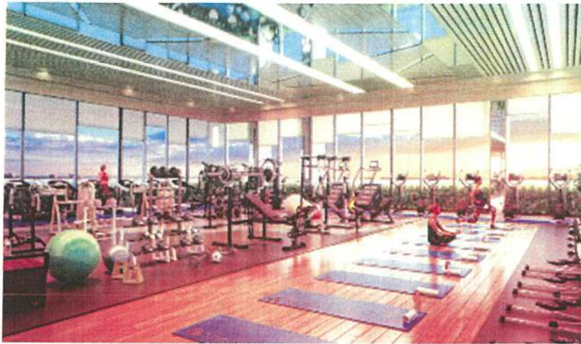
Khu vực tập gym, thể dục thể thao