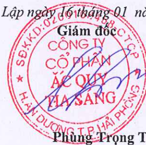
Phùng Trọng Tú