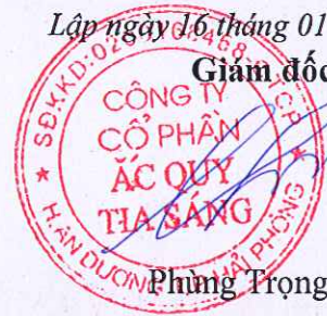
Phùng Trọng Tú