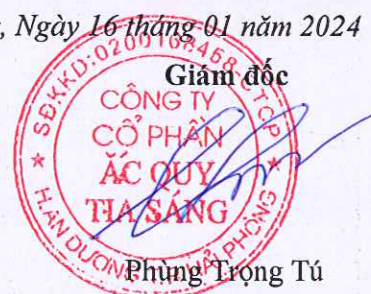
Phùng Trọng Tú