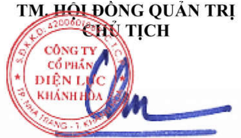
Nguyễn Cao Kỳ