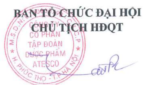
Trần Ngọc Thái

Xin vui lòng điện thoại xác nhận đã gửi hồ sơ về Ban tổ chức Đại hội. Mọi trường hợp nộp hồ sơ muộn hoặc bị thất lạc, nếu công ty không được thông báo xác nhận, thì các hồ sơ nộp muộn này không có giá trị./.