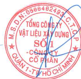
Cao Trường Thu