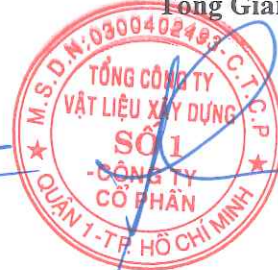
Cao Trường Thu