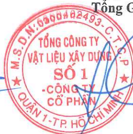
Cao Trường Thọ