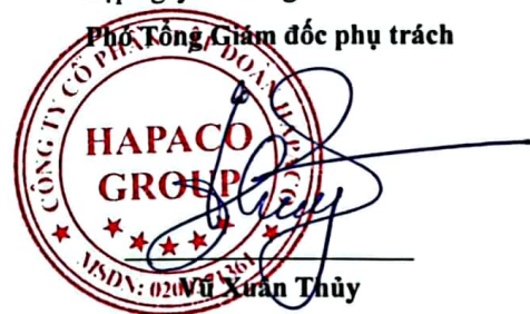
Wu Xuân Thủy