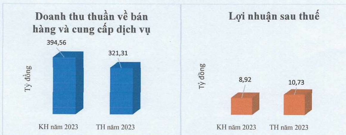
Bảng 1. Kết quả kinh doanh năm 2023 so với kế hoạch