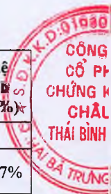
Bảng 2.1. Chênh lệch LNST trong kỳ báo cáo có sự chênh lệch trước và sau kiểm toán từ 5% trở lên