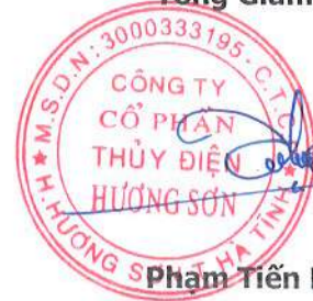
Phạm Tiến Dũng

Các thuyết minh từ trang 09 đến trang 32 là bộ phận hợp thành của báo cáo tài chính