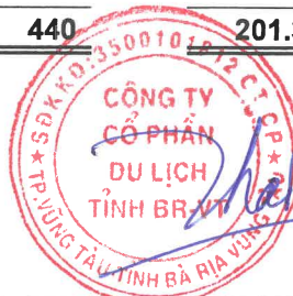
THÁI HOÀNG THÂN