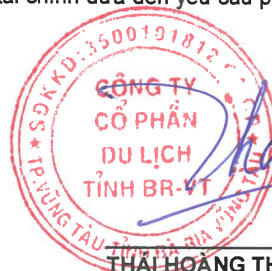
THAI HOANG THÂN

Chủ tịch Hội đồng quản trị Bà Rịa - Vũng Tàu, ngày 29 tháng 3 năm 2024