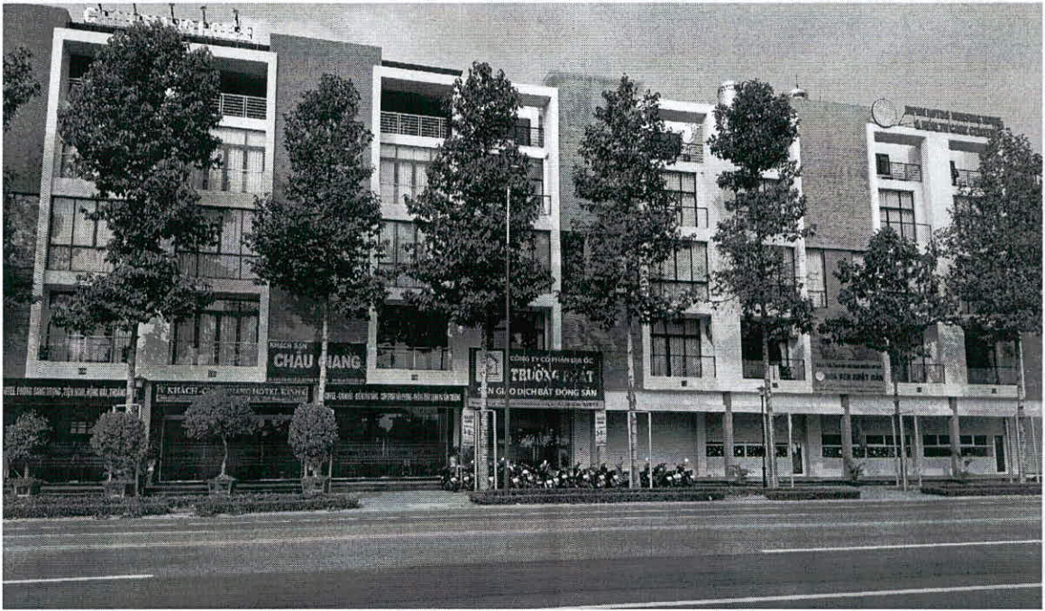
Hình ảnh nhà Dự án GREEN PEARL – TPM.BD (Giáp Đường Lê Lợi)