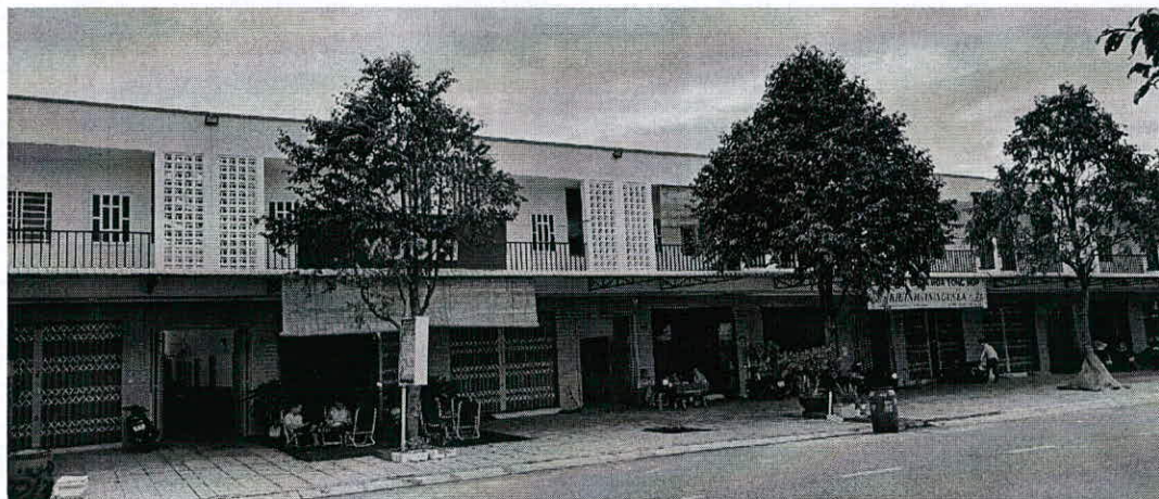
Hình ảnh nhà tại Lô A51/ Bàu Bàng (Bàn giao khách hàng)