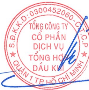
Phùng Tuấn Hà Chủ tịch HĐQT Ngày 29 tháng 3 năm 2024

Các thuyết minh từ trang 10 đến trang 55 là một phần cấu thành báo cáo tài chính riêng này.