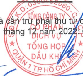
Phùng Tuấn Hà Chủ tịch HĐQT Ngày 29 tháng 3 năm 2024

Các thuyết minh từ trang 10 đến trang 55 là một phần cấu thành báo cáo tài chính riêng này.