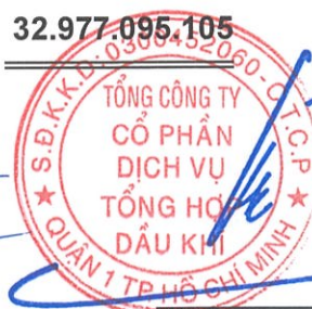
Phùng Tuấn Hà Chủ tịch HĐQT Ngày 29 tháng 3 năm 2024

Các thuyết minh từ trang 10 đến trang 55 là một phần cấu thành báo cáo tài chính riêng này.