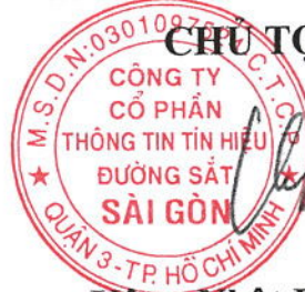
Uông Nhật Phương