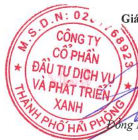
Đông Trung Hải