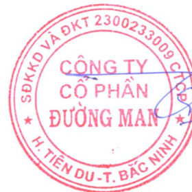
Trần Minh Thông Chủ tịch Hội đồng Quản trị Ngày 30 tháng 03 năm 2024