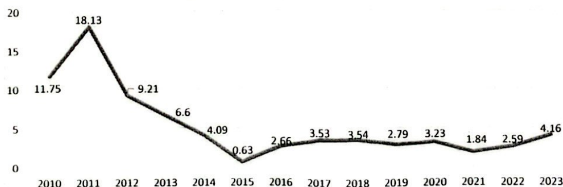
Biểu đồ 2: Tốc độ tăng CPI của các năm giai đoạn 2010-2023(%)

Năm 2023, nhìn chung, mặt bằng giá được giữ ở mức ổn định so với cùng kỳ năm trước, đạt mục tiêu Quốc hội đề ra là kiểm soát lạm phát ở mức 4,5%. Bình quân năm 2023, lạm phát cơ bản tăng 4,16% so với năm 2022 và cao hơn mức chỉ số giá tiêu dùng (CPI) bình quân chung (tăng 3,25%), điều này phản ánh biến động giá tiêu dùng chủ yếu do giá lương thực, xăng, dầu và gas tăng. Như vậy, năm 2023 mặt bằng giá cơ bản được kiểm soát.