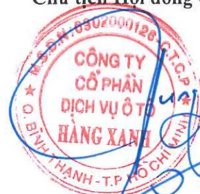
ĐỖ TIẾN DŨNG