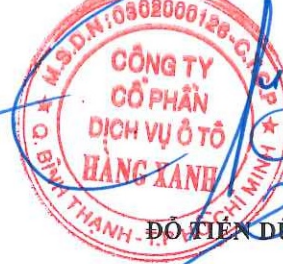
ĐỖ TIẾN DŨNG