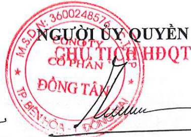
Lâm Bá Tông