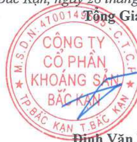
Đình Văn Hiến