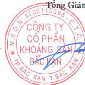
Đình Văn Hiến