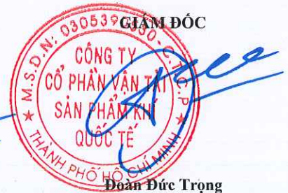
Đoàn Đức Trọng