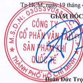
Đoàn Đức Trọng