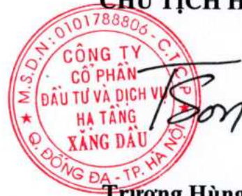
Trương Hùng Sơn