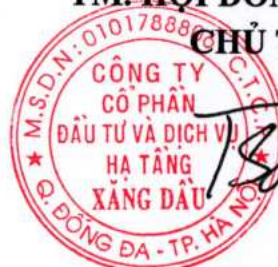
Trương Hùng Sơn