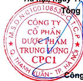
Công Việt Hải