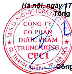
Công Việt Hải