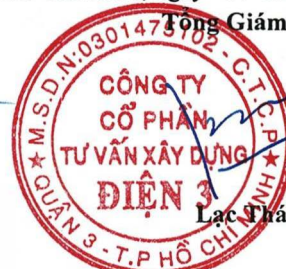
Lạc Thái Phước