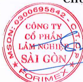
PHẠM VIẾT DƯƠNG