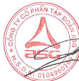
Dương Đức Tính Chủ tịch Hội đồng quản trị