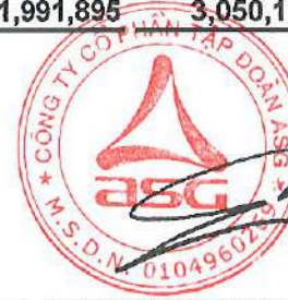
Dương Đức Tính Chủ tịch Hội đồng quản trị