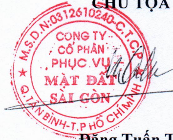
Đặng Tuấn Tú