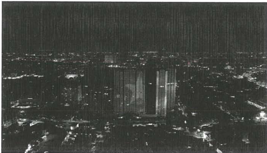
Hình ảnh dự án Hoang Huy Commerce (tòa HI) về đêm