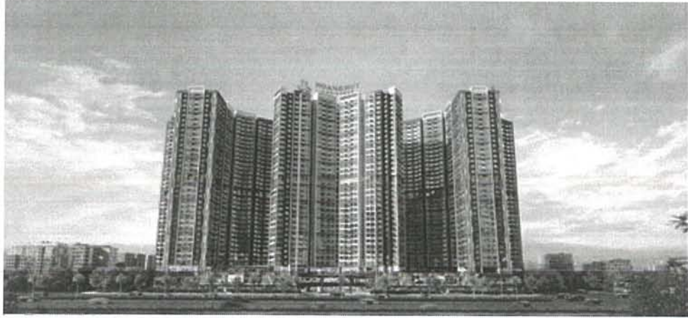
Mặt trước tòa HI giáp đường Võ Nguyên Giáp