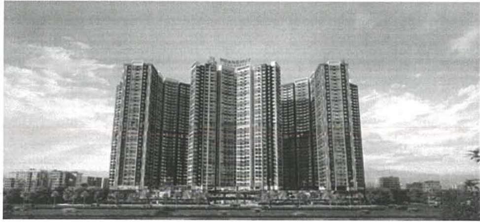
Mặt trước lô H1 giáp đường Võ Nguyên Giáp