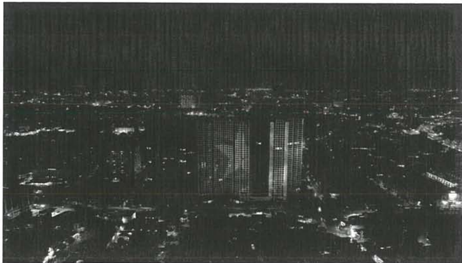
Hình ảnh dự án Hoang Huy Commerce (tòa H1) về đêm