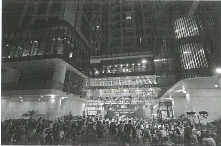
Hình ảnh Cư dân đã về sinh sống ổn định tại dự án Hoàng Huy – Sở Dầu