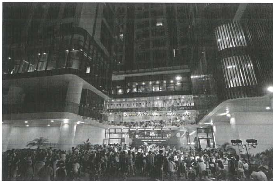
Hình ảnh Cư dân đã về sinh sống ổn định tại dự án Hoàng Huy – Sở Dầu