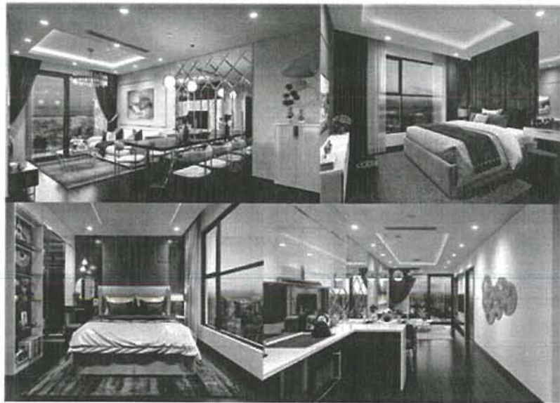
Căn hộ mẫu phong cách hiện đại tại dự án