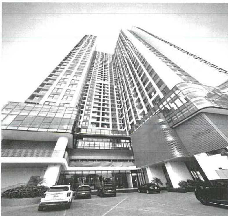
Hình ảnh mặt trước dự án Hoàng Huy – Sở Dầu