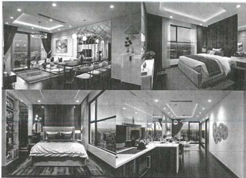
Căn hộ mẫu phong cách hiện đại tại dự án