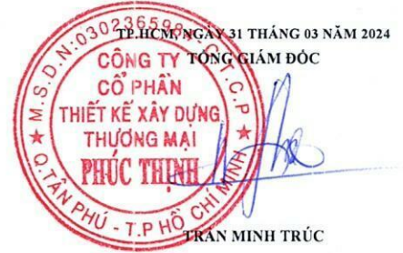
TRẦN MINH TRÚC