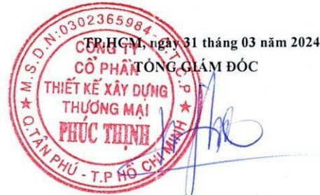
TRẦN MINH TRÚC