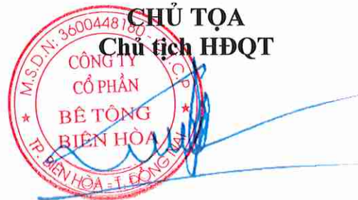
Trần Quốc Lập