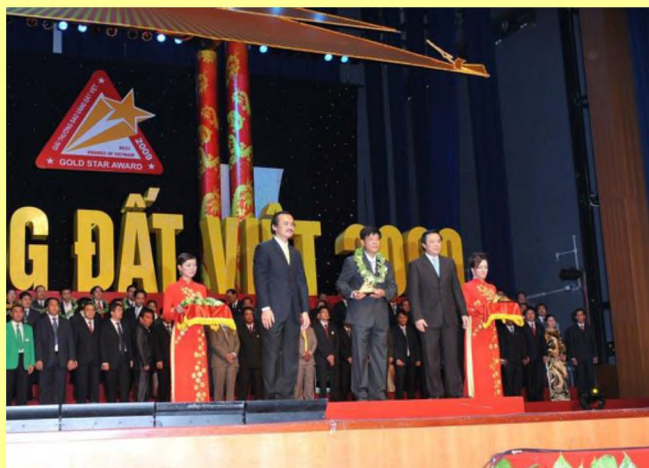
(Lãnh đạo Công ty nhận giải thưởng Sao vàng đất Việt lần thứ 2)