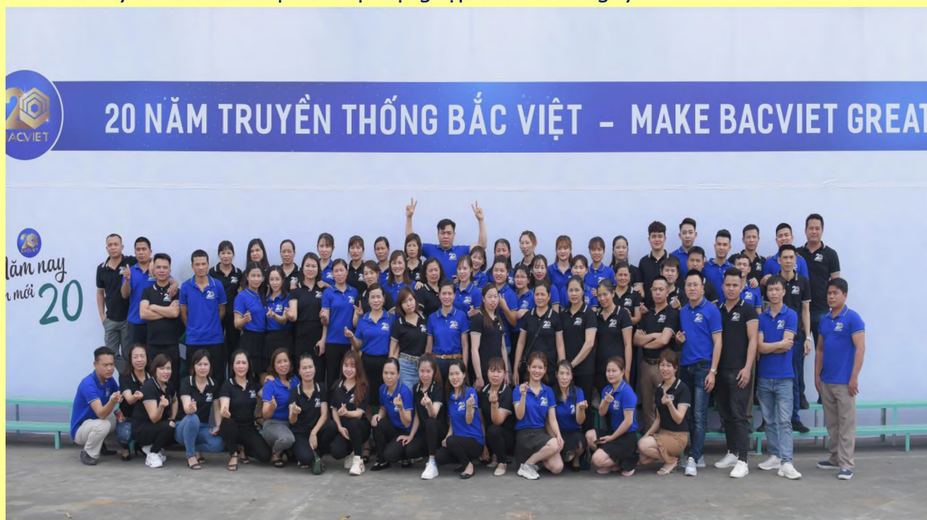
(Tập thể CBCNV tham dự 20 năm truyền thống Bắc Việt năm 2020)

Dưới đây là hình ảnh một số hoạt động tập thể của Công ty.