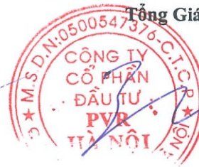
Đỗ Duy Điền