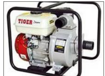
Máy xăng Máy cắt cỏ Máy bơm nước