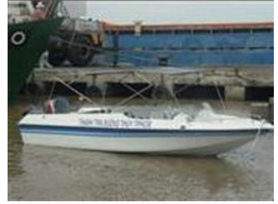
Cano Composite cao tốc