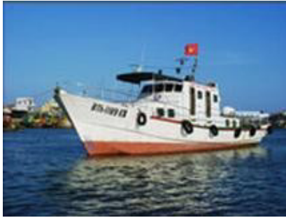
Tàu tuần tra, kiểm ngư