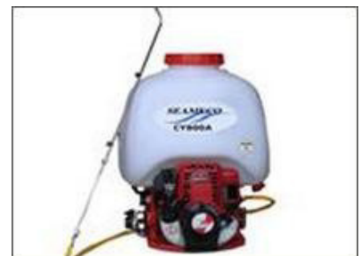
Máy phun thuốc