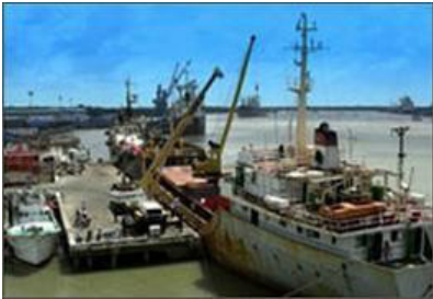
Dịch vụ cầu cảng