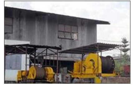
Dịch vụ lên xuống xà lan