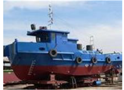
Tàu vỏ thép