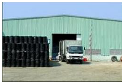
Dịch vụ kho bãi