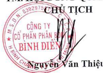
Nguyễn Văn Thiệu